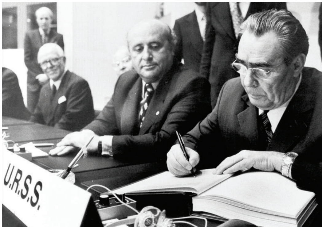
Helsinský záverečný akt podpísaný 1. augusta 1975 ustanovil desať základných princípov (Dekalóg), ktoré upravujú správanie sa štátov k sebe navzájom, ako aj k svojim občanom. Dokument usmerňuje činnosť OBSE dodnes.

Vznik OBSE siaha do 70. rokov 20. storočia, keď podpisom Helsinského záverečného aktu (1975) vznikla Konferencia pre bezpečnosť a spoluprácu v Európe (KBSE). Tá počas studenej vojny slúžila ako dôležité multilaterálne fórum pre dialóg a rokovania medzi Východom a Západom.