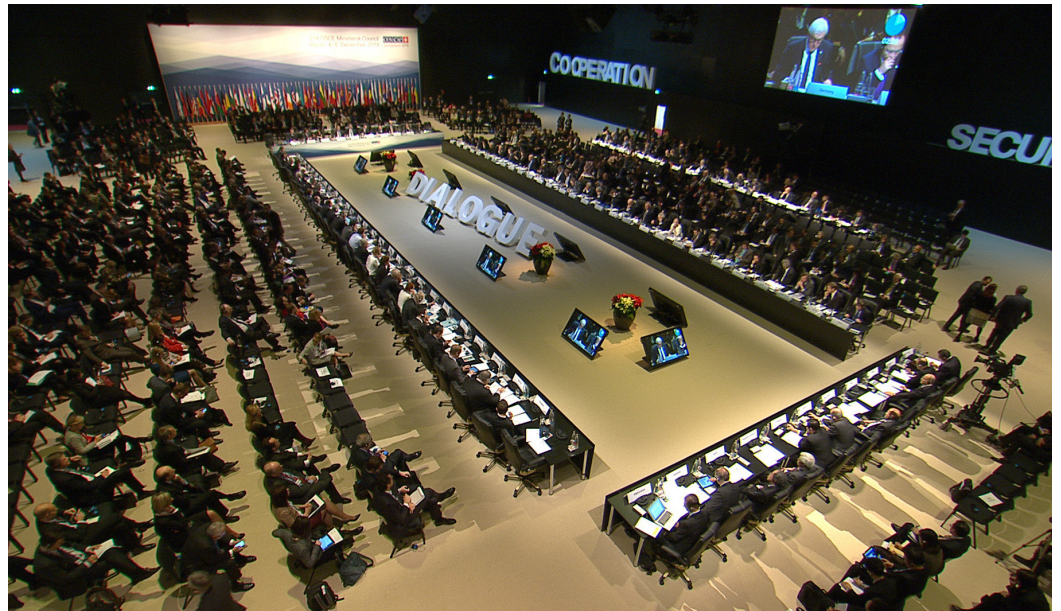
OBSE je medzivládnu organizáciou, v ktorej má 57 účastníckych štátov rovnocenné postavenie vo všetkých rozhodovacích orgánoch.

Činnosť OBSE v každej oblasti charakterizuje inklúzia. Všetky účastnícke štáty sú rovnocenné a rozhodnutia prijímajú konsenzom.