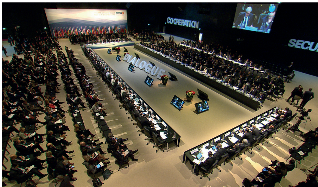
La OSCE es una organización intergubernamental en la que sus 57 Estados participantes colaboran en pie de igualdad en todos los órganos decisorios de la misma.

El carácter integrador constituye la base de todo lo que realiza la OSCE. Sus Estados participantes colaboran en pie de igualdad y aprueban las decisiones por consenso.