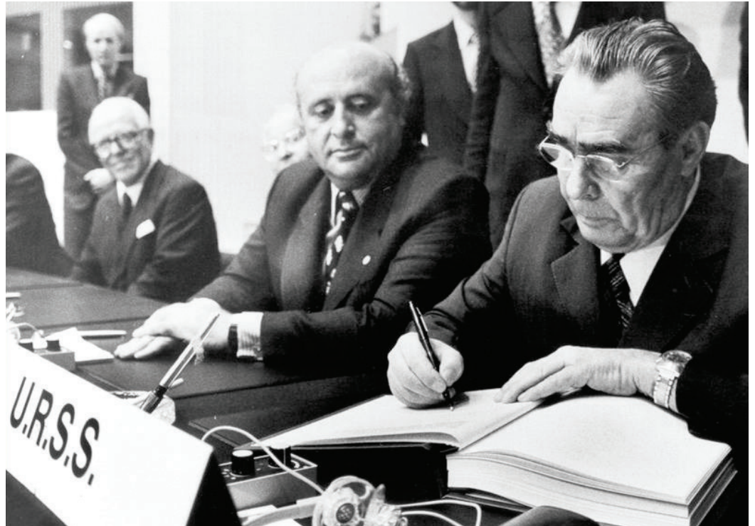
El Acta Final de Helsinki, firmada el 1 de agosto de 1975, establecía diez principios fundamentales (el "Decálogo") por los que debía regirse el comportamiento de los Estados para con sus ciudadanos y para con los demás Estados. Ese documento sigue guiando a día de hoy la labor de la OSCE.

La historia de la OSCE se remonta a los primeros años de la década de 1970, al Acta Final de Helsinki (1975) y a la creación de la Conferencia sobre la Seguridad y la Cooperación en Europa (CSCE), que durante la Guerra Fría se convirtió en un importante foro multilateral de diálogo y negociación entre el Este y Occidente.